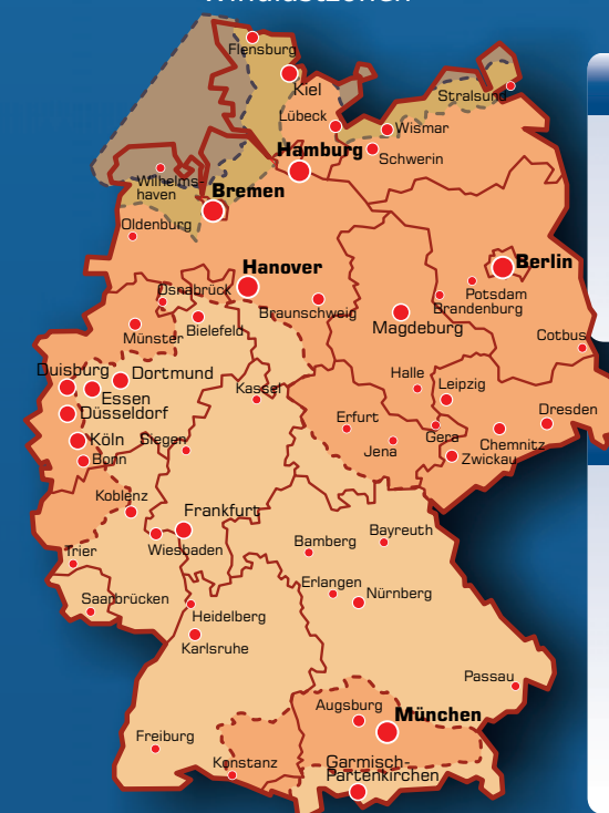
Tabelle charakteristischen Windlast table of characteristic wind load