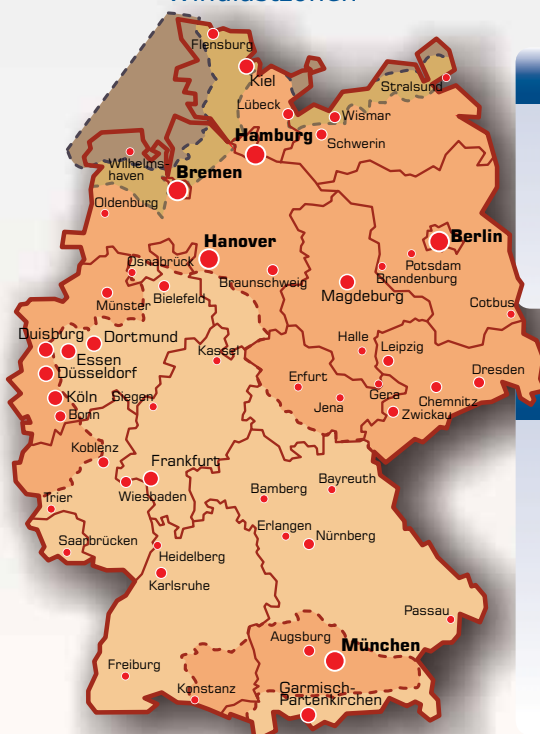
Tabelle charakteristischen Windlast table of characteristic wind load